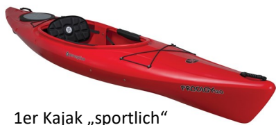
1er Kajak „sportlich“